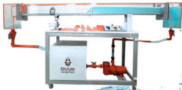
*Imagem de referência*