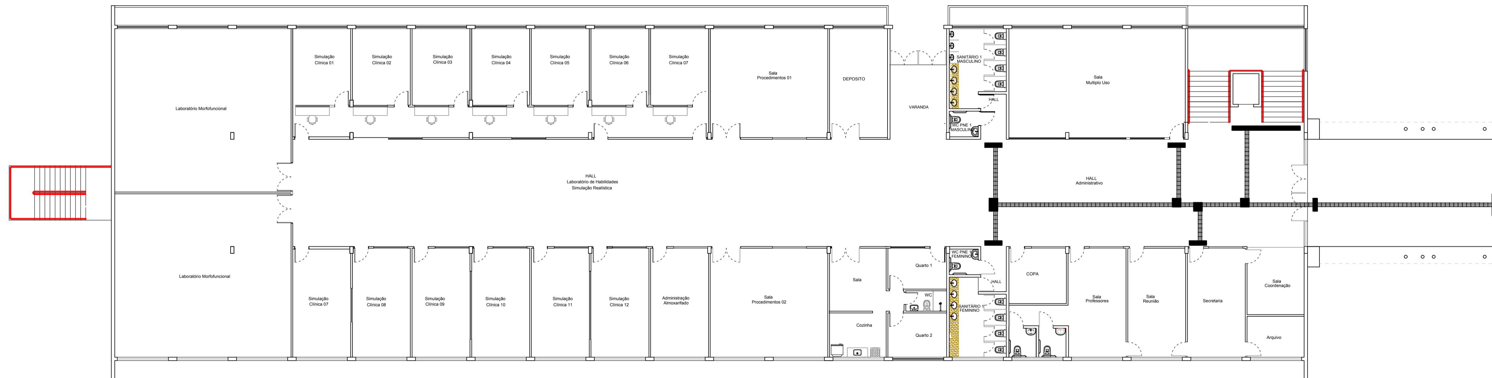
PLANTA BAIXA - BLOCO CIENCIAS SAUDE PAV. TERREO